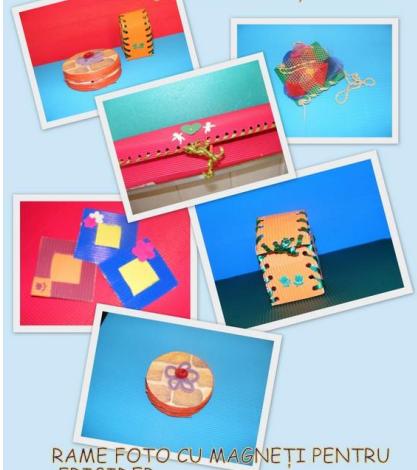
RAME FOTO CU MAGNEȚI PENTRU FRIGIDER CUTII DE BIJUTERII/CADOURI